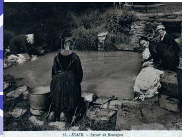
16. -SCAER. - Lator de Bouzigou